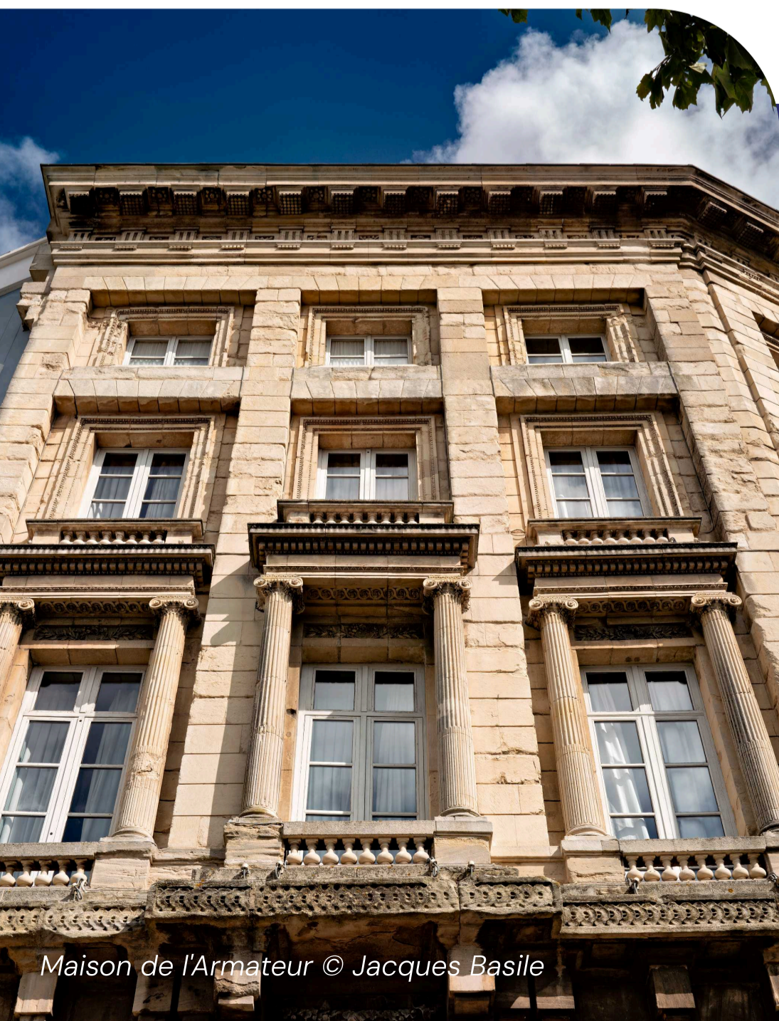
Maison de l'Armateur © Jacques Basile