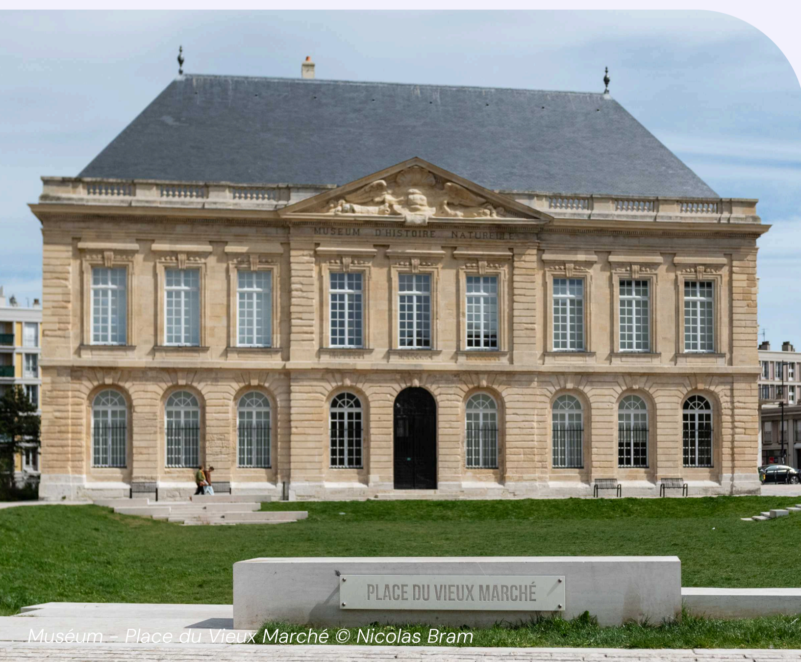
Muséum – Place du Vieux Marché

Dans une logique de modernisation et de structuration initiée en 2019 avec la création de la Direction Valorisation des patrimoines, la Ville s'est engagée dans un projet ambitieux : unifier la gestion de ses collections.